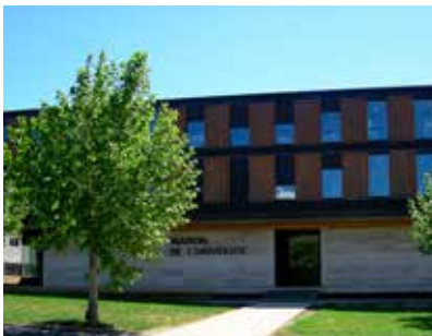
Maison de l'université

1h35 de Paris (15 liaisons aller-retour quotidiennes) 1h35 de l'aéroport Roissy-Charles de Gaulle 1h45 de Lyon 2h de Strasbourg 3h de Lille 3h30 de Marseille