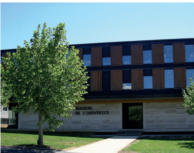
Maison de l'université

1h35 de Paris (15 liaisons aller-retour quotidiennes) 1h35 de l'aéroport Roissy-Charles de Gaulle 1h45 de Lyon 2h de Strasbourg 3h de Lille 3h30 de Marseille